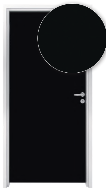
DIAMOND BLACK F2253