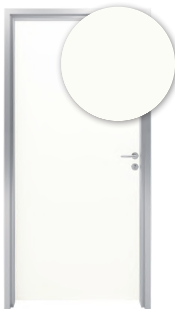
BLANC MEGÈVE B070