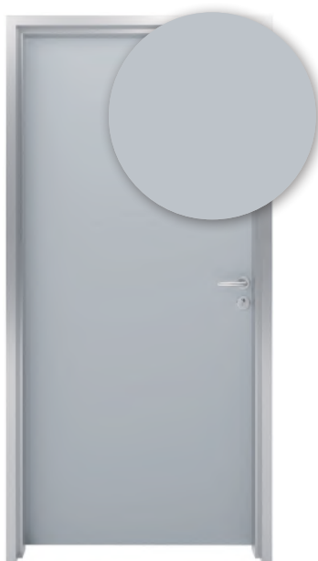
GRIS PERLE G003