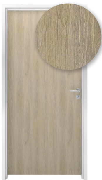
CHÈNE QUÉBEC C105 EXM