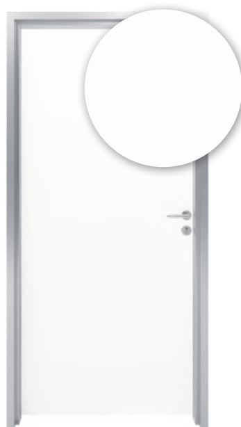
BLANC POLAIRE F2274